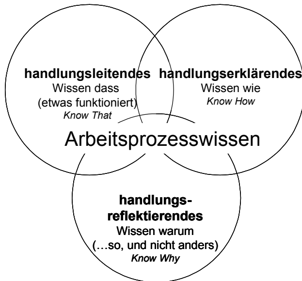
Abb. 2: Facetten des Arbeitsprozesswissens – in Anlehnung an HACKER (1996)

Lernens sowie das Diskutieren und Präsentieren lernen und dabei die gegebenen Gestaltungsspielräume für die Bearbeitung von Arbeits- und Lernaufgaben ausloten und ausschöpfen. Es kommt beim beruflichen Arbeitsprozesswissen nicht nur auf handlungsleitendes und handlungserklärendes Wissen an (HACKER 1996). Berufliche Kompetenz zeigt sich auch im handlungsreflektierenden Wissen; begründen zu können, warum etwas so und nicht anders ist (siehe Abb. 2).