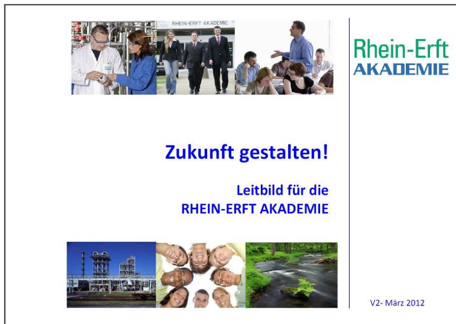
Abb. 3: Leitbild der Rhein-Erft Akademie

Nun sind Unternehmen in aller Regel keine autarken Einheiten, sondern in Produktions- und Vertriebsverbänden organisiert. Gerade in der produzierenden Industrie arbeiten Unternehmen eng zusammen und bedingen sich in ihren Ablaufprozessen. Über Zertifikate sind Standards gesetzt, die dieses Zusammenspiel erleichtern. Nachhaltige Aspekte sind dabei aber leider kaum bis gar nicht zu finden. Im Projekt NaBiKa wird, diesen Gedanken aufnehmend, versucht werden, bestehende Verbände auf gemeinsame verbindliche Nachhaltigkeitsgrundsätze zu verpflichten. Konkret bezieht sich dies auf einen Chemiapark, in welchem produzierende Unternehmen mit Dienstleistern im technischen wie auch administrativen Bereich zusammenarbeiten. Stoffverbände, gemeinsame Infrastruktur (z.B. Werkfeuerwehr und Werkschutz) und die direkte Arbeit vor Ort ergeben so viele Schnittstellen, dass sich ein gemeinsames Leitbild als „Entwicklungsplan“ anbietet. Ziel ist die Erstellung eines bundesweit ersten Leitbildes für einen ganzen Industriestandort, der sich an den Prinzipien der Nachhaltigkeit orientiert.