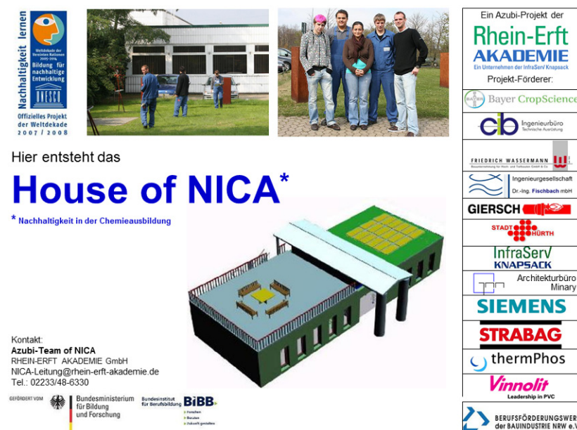
Abb. 4: Bauschild „House of NICA“

Bereits im Vorgängerprojekt NICA (Nachhaltigkeit in der Chemieausbildung) wurde das Ziel ausgegeben, die Auszubildenden in ihren grundlegenden Wertvorstellungen im Sinne einer nachhaltigen Entwicklung zu prägen. Nach der Phase „spielerischer“ Sensibilisierung (z.B. anhand des Nachhaltigkeitskoffers; IRIS 2013) wurde rasch der Fokus auf die pragmatische Umsetzung nachhaltigen Handelns gelegt – und auf die Möglichkeit nachhaltigen Handelns im Betrieb.