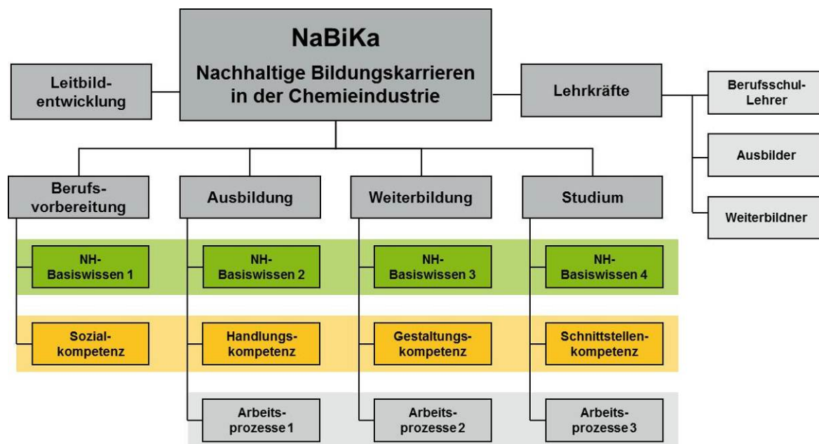
Abb. 2: Projektdesign NaBiKa

Der Projektansatz geht davon aus, dass nachhaltiges berufliches Handeln geprägt wird durch Kompetenzen und Handlungsoptionen. Dabei wird zunächst in Kauf genommen, dass der Kompetenzbegriff – ähnlich wie der Nachhaltigkeitsbegriff – wissenschaftlich nicht eindeutig geklärt ist. Unzählige Begriffsdefinitionen und Auseinandersetzungen in der Literatur der Kompetenzforschung führen weniger zu einer klaren Vorstellung davon, was Kom-