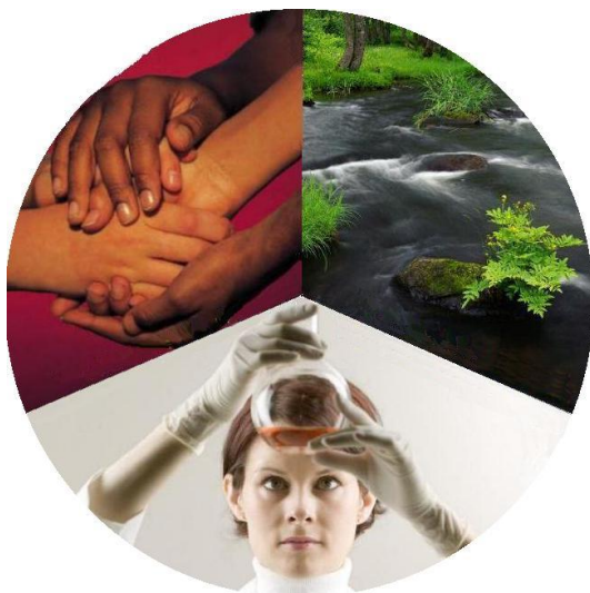
Abb. 1: Drei Dimensionen der Nachhaltigkeit

Nachhaltig beruflich handeln kann nur derjenige, der auch die Möglichkeit dazu hat. Dies setzt allerdings entsprechende Handlungskompetenzen und Handlungsoptionen bei den Mitarbeitern voraus. Und das sind nicht wenige: die deutsche Chemieindustrie zählte in 2012 immerhin rund 437.000 Beschäftigte (VCI 2012). Die berufliche Nachhaltigkeitsqualifizierung dieser Beschäftigten stellt damit eine gewaltige Herausforderung dar. So sind nicht nur Unterschiede in Wissensstand, Einstellungen und Handlungsmöglichkeiten, sondern auch die verschiedenen Ebenen der Berufsqualifikation der Mitarbeiter zu beachten. Der vorliegende Beitrag beschreibt pragmatische Ansatzpunkte, wie das Leitbild der nachhaltigen Entwicklung exemplarisch in der beruflichen Bildung der Chemieindustrie umgesetzt werden kann. Dabei steht das gesamte Spektrum der beruflichen Bildung von der Berufsvorbereitung bis hin zum Studium im Fokus.